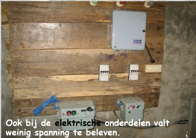
Ook bij de elektrische onderdelen valt weinig spanning te beleven.

Nepal - Het is terloops al vaker ter sprake gekomen, zowel in onze nieuwsbrieven als op de sites van onze vrijwilligers: het elektriciteitsprobleem van Nepal. Je kan er ook bijna niet omheen, het hele land heeft te maken met periodes waarop er geen elektriciteit is. Die periodes worden steeds langer en komen ook steeds vaker voor. Op dit moment is er 16 uur per dag geen elektriciteit. Dat wil zeggen dat 2/3 e van de dag het stopcontact 'droog' staat en er geen lamp brandt. Slechts gedurende de overige 8 uur per dag is er stroom. Die 8 uur zijn over het algemeen verdeeld in 2 blokken van 4 uur: een blok valt midden in de nacht (als heel Nepal slaapt—o zo handig) en een blok valt overdag of ook vaak in de vroege avond. Nu kun je je daar voor een deel nog op instellen door accu's op te laden (telefoons bv) of werkzaamheden te verschuiven ('s nachts de wekker zetten en opstaan om een printje te maken). Maar voor een deel zijn we gewoon slachtoffer van de situatie en kunnen we alleen maar lijdend toezien. En in die laatste categorie valt bijvoorbeeld onze nieuwe rijstpelmachine van Sanneke en Iris.