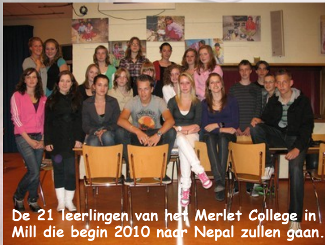
De 21 leerlingen van het Merlet College in Mill die begin 2010 naar Nepal zullen gaan.

De leerlingen realiseren zich dat hun vliegreis jammer genoeg wel de onoverkomelijke CO 2 -uitstoot met zich meebrengt. Maar ook hier is een oplossing voor bedacht: de leerlingen gaan geld bijeenbrengen om 4 biogas-installaties in Nepal te kunnen bekostigen. En die 4 installaties samen zullen de aankomende jaren meer CO 2 besparen dan hun vlucht zal creëren. Een zeer bemoedigingswaardig initiatief!