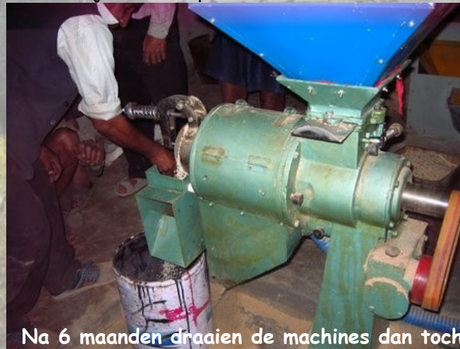
Na 6 maanden draaien de machines dan toch.

Thulachaur - Het kon ook bijna niet anders. In de vorige nieuwsbrief schrijven we na maanden wachten eindelijk een artikel over de perikelen met de rijstpelmachines in Thulachaur, die jammer genoeg niet kunnen draaien omdat er problemen zijn met de elektriciteit, en de week na het verschijnen van de bewuste nieuwsbrief ontvangen we spontaan een mailtje vanuit Nepal. Er staat kennelijk een gunstige wind in de lokale politiek in Pokhara want de vergunning wordt pardoes afgegeven, de krachtstroom wordt direct aangelegd en we ontvangen zowaar een foto van de eerste zakken rijst die gepeld worden. Nu maar hopen dat de elektriciteit het niet laat afweten en dat de dorpelingen veel zakken rijst kunnen pellen.