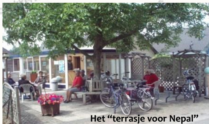
Het “terrasje voor Nepal”

Wij hebben ook een flyer gemaakt om elke klant van de acties op de hoogte te stellen en juichen overige giften uiteraard ook toe.”