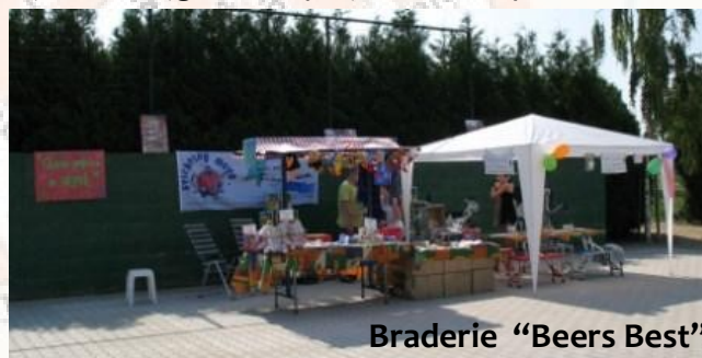
Braderie “Beers Best”

Deze zomer staan er nog een aantal markten op het programma in de regio. Met activiteiten voor kinderen als schilderen en de verkoop van ingezamelde spulletjes hopen de leerlingen geld bijeen te krijgen voor projecten in Nepal.