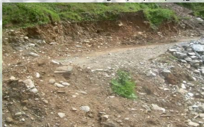
Lokatie van toekomstige kleuteropvang

Thulachour – In nieuwsbrief 33 konden we berichten dat de gemeente Wijchen ons beloofd had voor ons projectvoorstel inzake de bouw van een kleuteropvang in Thulachour met een subsidie van 1650 euro. De begroting is daarmee nog niet helemaal afgedekt, maar we zijn inmiddels begonnen met het bouwrijp maken van de grond en het hakken van de benodigde stenen. Het lokaal komt naast de huidige basisschool maar zal een eigen speelpleintje krijgen.