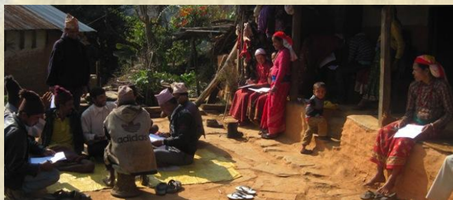
Dorpsbewoners in Thulachaur druk aan het schrijven.

Met de resultaten kan Stichting Maya de hulpverlening beter aanpassen aan de behoeftes van de mensen.