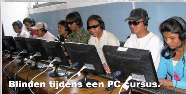
Blinden tijdens een PC cursus.

Wij hebben het instituut inmiddels kunnen helpen met de aanschaf van een aantal E-book readers—zodat de cursisten boeken via gesproken woorden kunnen luisteren ipv te lezen—en een aantal softwarepakketten die blinden helpen met leren typen op de PC. Vanaf nu zullen we ook helpen met het plaatsen van vrijwilligers. Dus als dit je aanspreekt: neem contact met ons op.