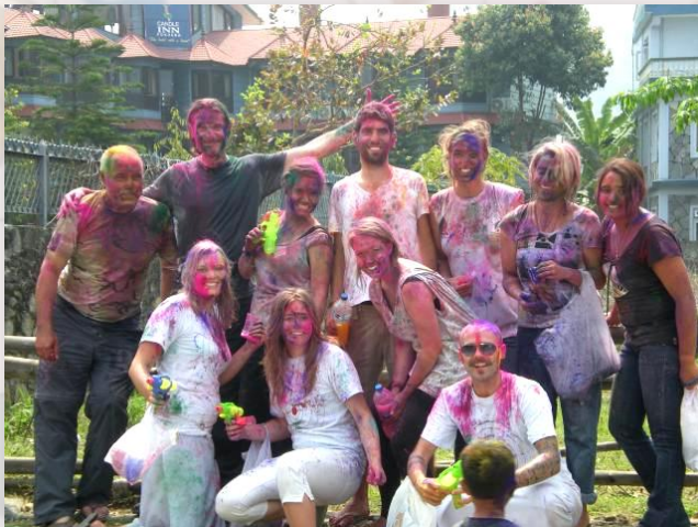
Maya vrijwilligers vieren Holi in Pokhara, maart 2011

Zin om naar Nepal te komen en met de kinderen van het tehuis "Our Children Home" spelletjes te doen, buiten te spelen, huiswerk te maken en allerlei andere dingen? Je bent meer dan welkom in deze mooie omgeving. Een gezellig huis waar je je eigen kamer hebt en mee kan eten met de kids. Overdag als de kinderen naar school zijn, heb je ruim de tijd om Nepal te verkennen, wat rond te slenteren, bootje te varen op het Fewa Meer, of zelfs aan paragliding te doen. Stuur een mail voor meer informatie naar ons bekende email adres.