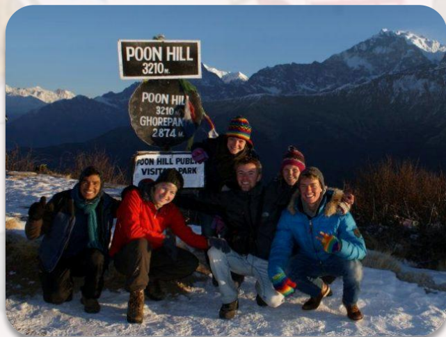
Maya stagiairs op Poon Hill, januari 2012

Zin om naar Nepal te komen en met de kinderen van het tehuis "Our Children Home" spelletjes te doen, buiten te spelen, huiswerk te maken en allerlei andere dingen? Je bent meer dan welkom in deze mooie omgeving. Een gezellig huis waar je je eigen kamer hebt en mee kan eten met de kids. Overdag als de kinderen naar school zijn, heb je ruim de tijd om Nepal te verkennen, wat rond te slenteren, bootje te varen op het Fewa Meer, of zelfs aan paragliding te doen. Stuur een mail voor meer informatie naar ons bekende email adres.