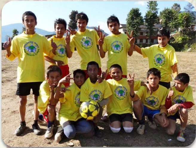
Eén van de teams.