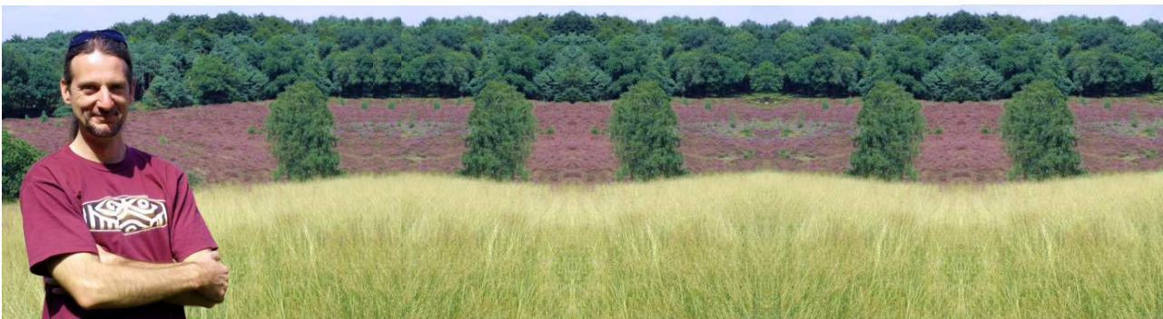
Een natte zomer dit jaar in Nederland – de heide staat gelukkig volop in boei!