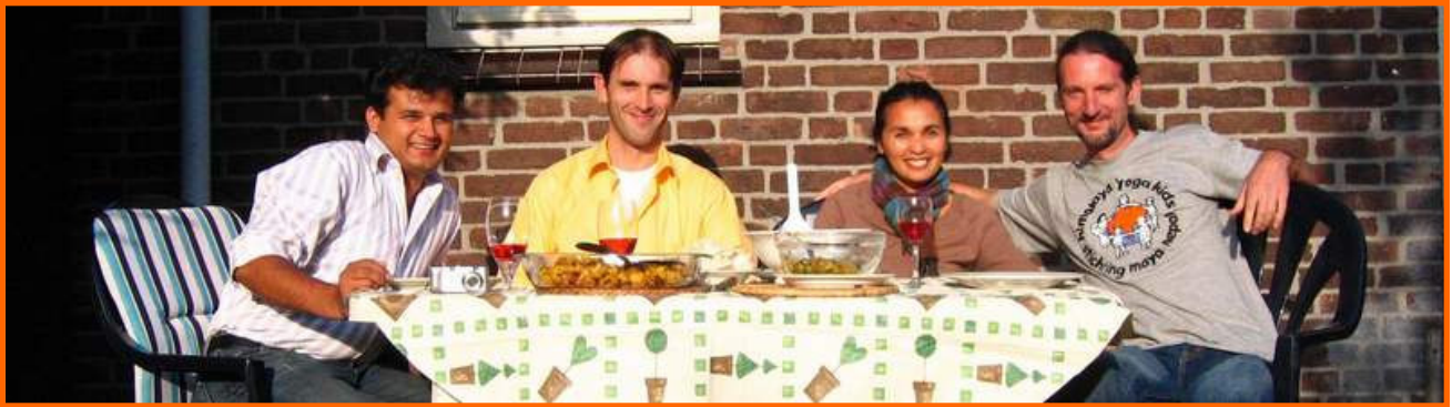
Zomer in Nederland met een echte "dal baht" outdoor dinner... met als guest of honour een Nepalese broer die ook nog eens een uitmuntend kok bleek te zijn!