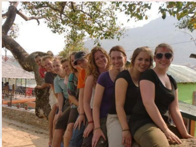
Maya vrijwilligers in Bandipur, Nepal.

Zin om naar Nepal te komen en met de kinderen van het tehuis "Our Children Home" spelletjes te doen, te sporten, huiswerk te maken en allerlei andere dingen? Je bent meer dan welkom in deze mooie omgeving. Een gezellig huis waar je je eigen kamer hebt en mee kan eten met de kids. Overdag als de kinderen naar school zijn, heb je ruim de tijd om Nepal te verkennen, wat rond te slenteren, bootje te varen op het Fewa Meer, of zelfs aan paragliding te doen. Stuur een mail voor meer informatie naar ons bekende email adres.