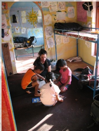
Weeskinderen aan hun huiswerk; op de grond.

“Waarom vrijwilligerswerk? Die vraag is mij door mijn omgeving al vaak gesteld. Vorig jaar heb ik drie maanden door Zuidoost Azië gereisd. Dit was een fantastische ervaring, maar ik miste het echte contact met de mensen. Door een aantal maanden op één plek te zijn en mee te draaien met de bevolking hoop ik het land van binnenuit te zien. Aan