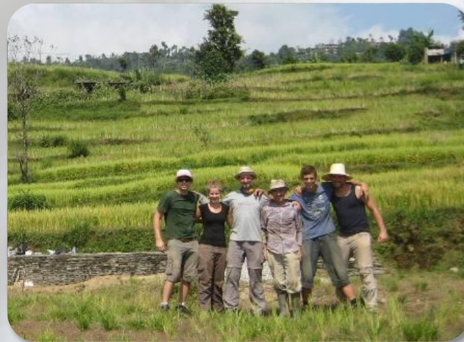
De bouwgroep te midden van de rijstvelden

Het is overdag goed warm op het terrein aangezien het pal op het zuiden gesitueerd is. We starten om 6 uur 's ochtends om de ergste hitte voor te zijn voor de lunch. Aan het eind van de middag zijn er dan ook nog een paar uurtjes waarin het zonnetje wat afzwakt en het wat draaglijker is. Al met al lange dagen, maar de sfeer is opperberst.