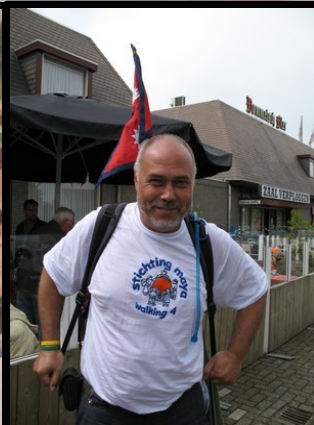
Dag 2: op pad in Wijchen!