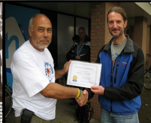
Dag 4: de overhandiging van de cheque!