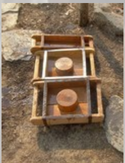
Vorbereiding: het juiste gereedschap

De week werd afgesloten met een heerlijke nepalese maaltijd, nog op de ouderwetse manier bereid op open vuur... de nieuwe ovens met schoorsteen moesten nog een weekje nadrogen voor ze gebruikt kunnen worden. Maar iedereen kon tevreden terugblikken op een zeer geslaagd project.