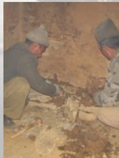
Stap 3: de gebakken stenen opstapelen.