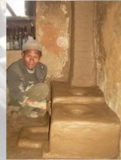
Stap 4: het eindresultaat