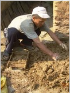
Stap 1: de mallen vullen met klei.