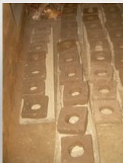
Stap 2: de stenen laten drogen