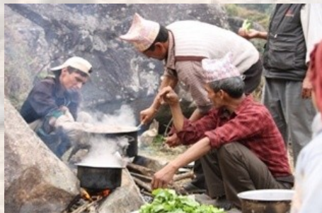
Grote kookpotten op het vuur.