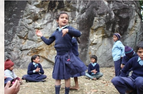
En na de picknick lekker dansen.