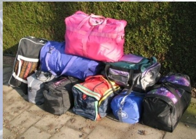
9 weekendtassen: kleding, knuffels en EHBO spullen.

We krijgen regelmatig items aangeboden van mensen die het graag willen doneren aan kinderen in Nepal: knuffels, kinderkleding, spelletjes en ander speelgoed, maar ook brillen, medicijnen en verbandmaterialen. Allemaal dingen waar in Nepal gebrek aan is en die we maar wat graag uitdelen. Omdat we tijdens de vlucht een beperkte hoeveelheid bagage mogen meenemen, blijft er altijd wel een deel van de ingezamelde artikelen achter in Nederland die we opslaan op ons secretariaat en bij vrijwilligers thuis, wachtend op een volgende vlucht. Die vlucht is nu gekomen: op 13 februari kan het allemaal naar Nepal.