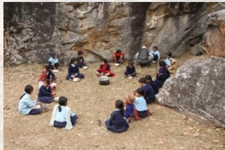
Gezellig samen eten in een kring.