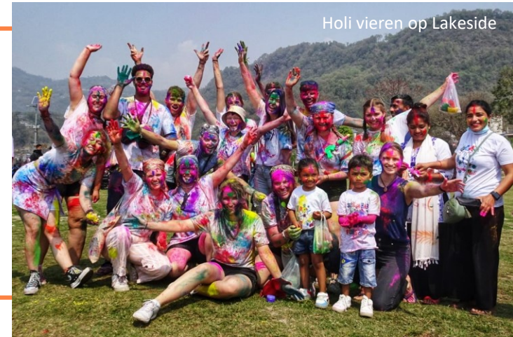
Holi vieren op Lakeside

Iedere feestdag heeft zijn eigen gebruiken en lekkernijen. Onze vrijwilligers kijken vaak het meest uit naar Holi, omdat het één groot feest is en de vergelijkingen met carnaval (wat ze dat jaar missen) overduidelijk zijn.