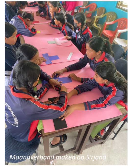
Maandverband maken op Sirjana

Om de slagkracht op het vlak van zorg te verbreden zijn er voorbereidingen getroffen om de Werkgroep Zorg opnieuw in te richten. Er zijn diverse vrijwilligers bereid gevonden om hiermee aan de slag te gaan.