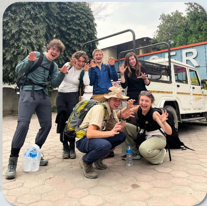
De huidige groep vrijwilligers op safari in Chitwan.

Voor andere vacatures in Nepal kijk op onze website