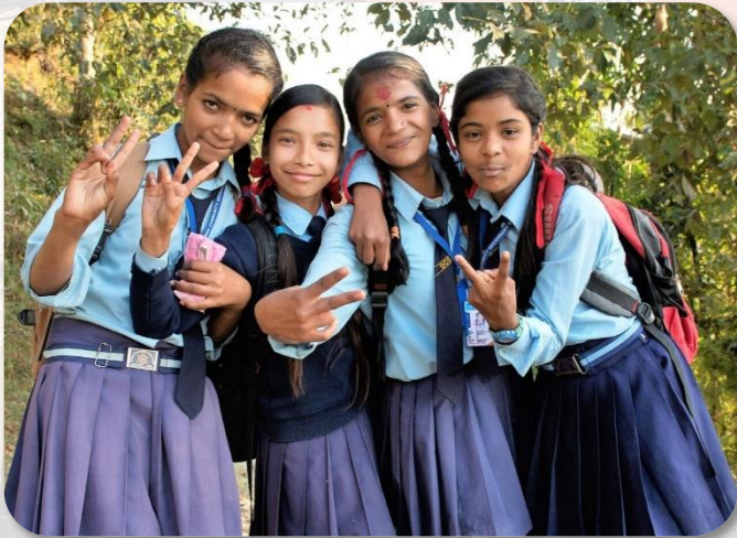
Blijde koppies van sponsorkinderen uit Adhikaridanda

Nederland – Sinds de vorige nieuwsbrief is de nog piepjonge werkgroep Maya Scholarship Program (MSP) druk in de weer geweest. Het doel is om zoveel mogelijk kinderen uit arme gezinnen te koppelen aan Nederlandse donateurs, zodat de kinderen zonder geldzorgen naar school kunnen gaan en alle benodigde boeken, schrijfgerei en schoolkleding krijgen. De donateur steunt gedurende 5 jaar, zodat het kind de hele basisschool of middelbare school kan afmaken.