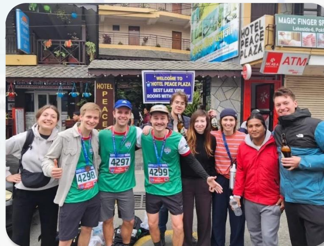
Onze halve marathon helden en supporters.

Wil je ook een kind een beurs gunnen? Kijk op de website voor meer info of om je aan te melden.