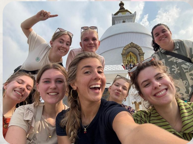
Happy times bij de Peace Pagoda nabij Pokhara.

Voor andere vacatures in Nepal en Nederland, kijk op onze website .