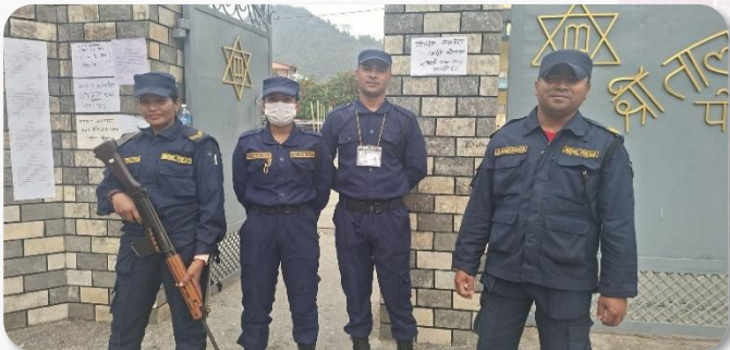
Politie voor een tot stembureau omgetoverde school.

Vanuit Nederland spraken we online met een aantal van onze eigen oud-schoolbeursjongeren. Zij spreken openlijk hun steun uit voor oud-rapper Balan van de jonge RSP partij: “Nepal needs fresh leadership and new ideas. Supporting new political forces could help bring change, accountability, and better governance.” Balan is favoriet omdat hij als burgemeester van Kathmandu heeft laten zien dat hij grote problemen als verkeer en corruptie echt aanpakt.